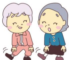
集団フィットネス 普段の運動のマンネリを打破、積極介入！！

施設向けフィットネス・マッサージ・エステサービス、好評実施中♪ 4月は過去最多、なんと計8施設で実施！