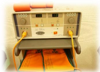
マグナーで腰を温めると体がポカポカ 運動効果倍増！集団フィットネス時に使用