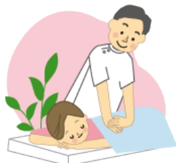
無料マッサージ体験会