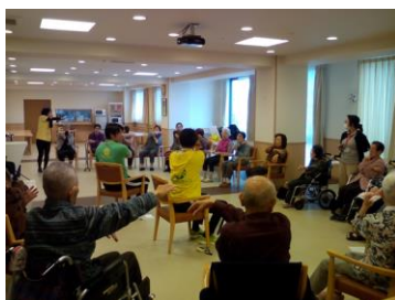
集団フィットネス