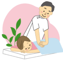
無料マッサージ体験会