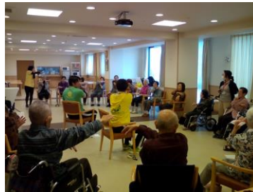
集団フィットネス