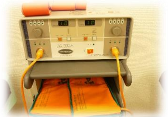
マグナーで腰を温めると体がポカポカ 運動効果倍増！集団フィットネス時に使用