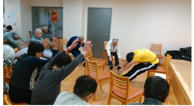
転倒予防体操@四季の森様