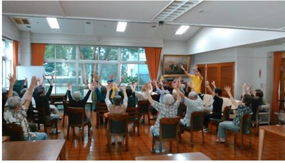
転倒予防体操@東野園様