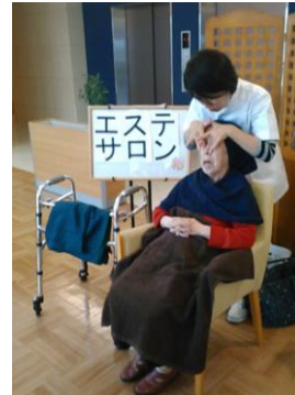
エステ体験会 も実施♪

各事業所様のニーズに応じたサービス・体験会をご提案いたします。 ～お気軽にお声をお掛けください～