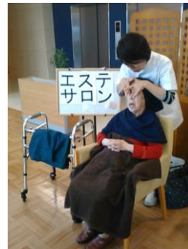
エステ体験会 も実施♪