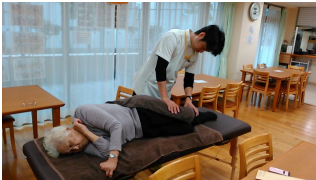
無料マッサージ体験会@四季の森様