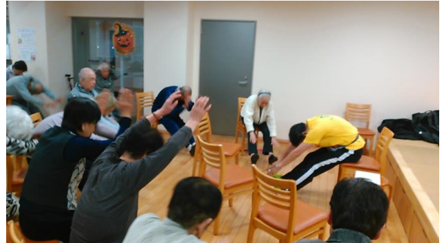
転倒予防体操@四季の森様