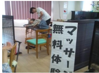
無料マッサージ体験会