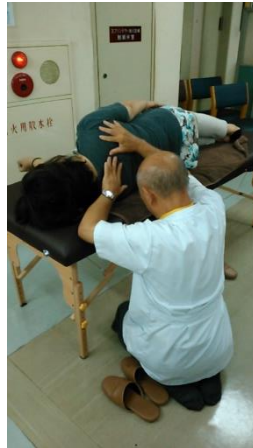
無料マッサージ体験会