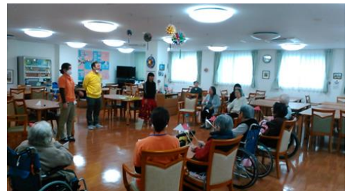
3/5（月）フラダンス体操