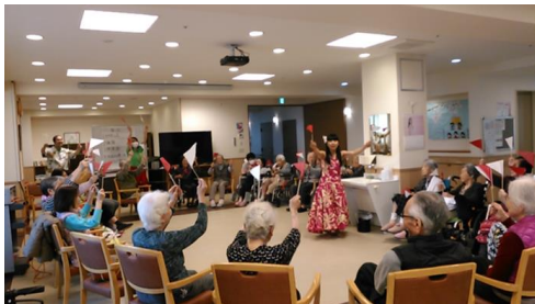
3/29（木）フラダンス&体操